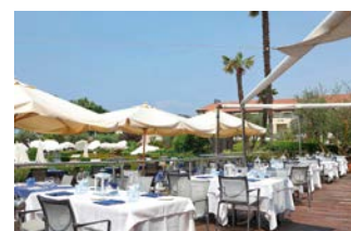
Das 4-Sterne Hotel Caesius Therme & Spa mit großzügigem Wellnessbereich liegt im malerischen Ort Bardolino am Gardasee.